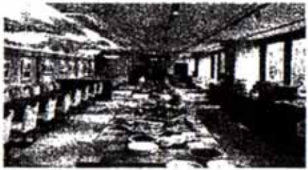
レストラン「Patio」ご朝食06:30~10:30